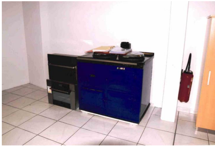
↵ Cuisinière électrique imitant Les anciens fourneaux